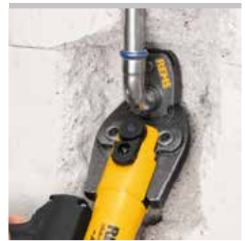
REMS anillo de prensar 45° (PR-2B) Patente EP 2 774 725