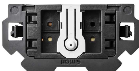
Vista frontal Interruptor unipolar pulsante 10 AX 250V~ con sistema de embornamiento 1click® Simon 100