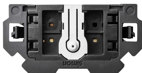
Vista frontal Cruzamiento pulsante 10 AX 250V~ con sistema de embornamiento 1click® Simon 100