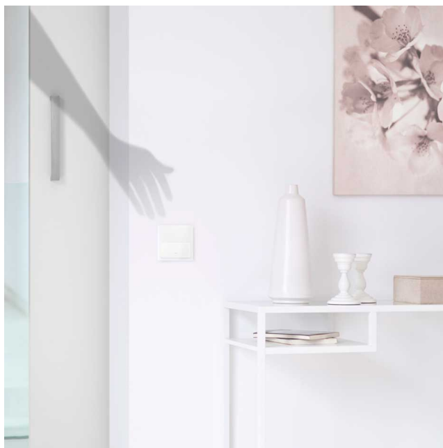
Aplicación marco mínimo 1 elemento Simon 100 blanco en salón