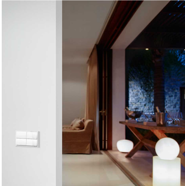
Aplicación marco mínimo 2 elementos Simon 100 negro en salón